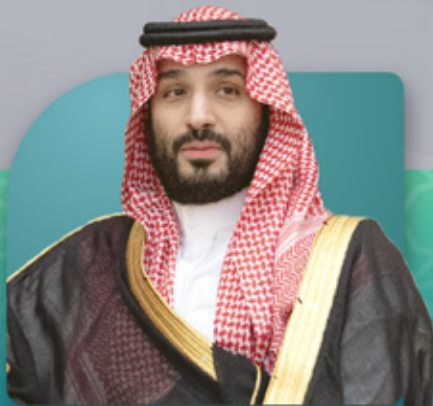
صاحب السمو الملكي الأمير محمد بن سلمان بن عبدالعزيز آل سعود ولي العهد رئيس مجلس الإدارة

لا بد أن نهتم بالمساجد قبل أن نهتم بالمساجد