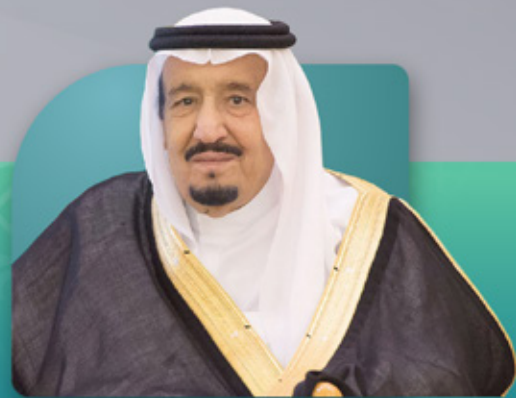
خادم الحرمين الشريفين الملك سلمان بن عبدالعزيز آل سعود ملك المملكة العربية السعودية

المساجد في المملكة هي بيوت الله، ويجب أن تكون من أفضل الأماكن بناءً وجملاً واهتماماً، وهو ما تسعى إلى تحقيقه لضمان تقديمها بشكل يليق بروحانياتها ومكانتها