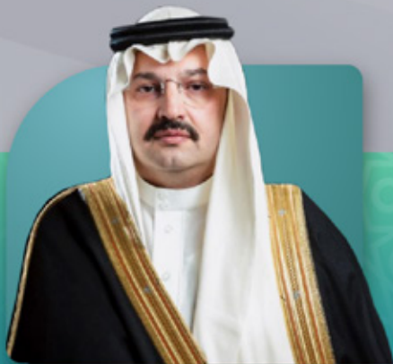
صاحب السمو الملكي الأمير تركي بن طلال بن عبدالعزيز آل سعود أمير منطقة عسير

لا بد أن نهتم بالمساجد قبل أن نهتم بالمساجد